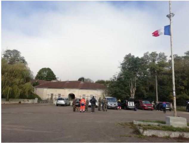
Arrivée au fort -Présentation des associations et café de bien venue