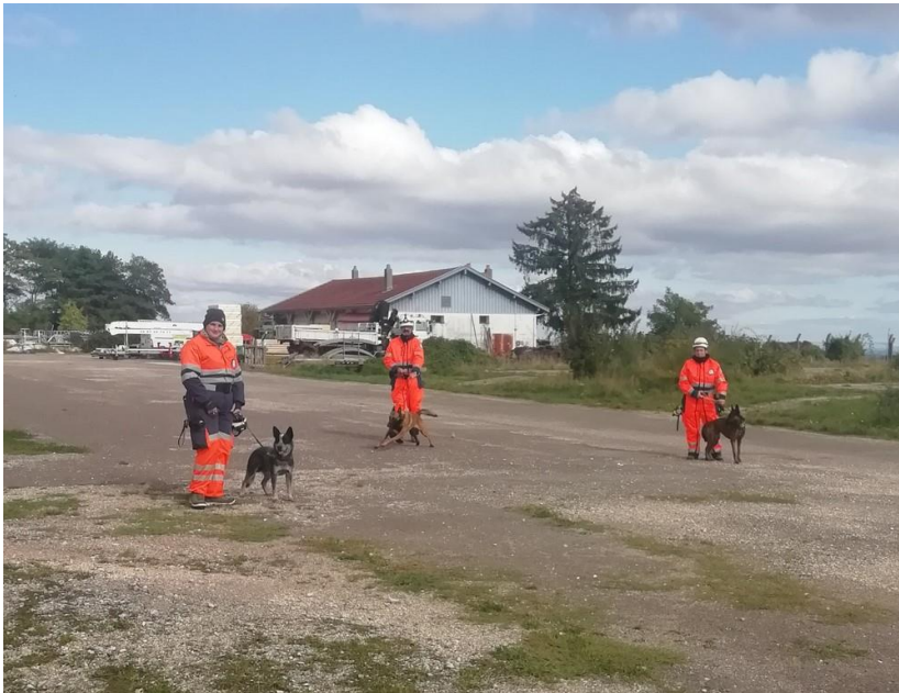
Mise en place et consignes pour les premiers exercices